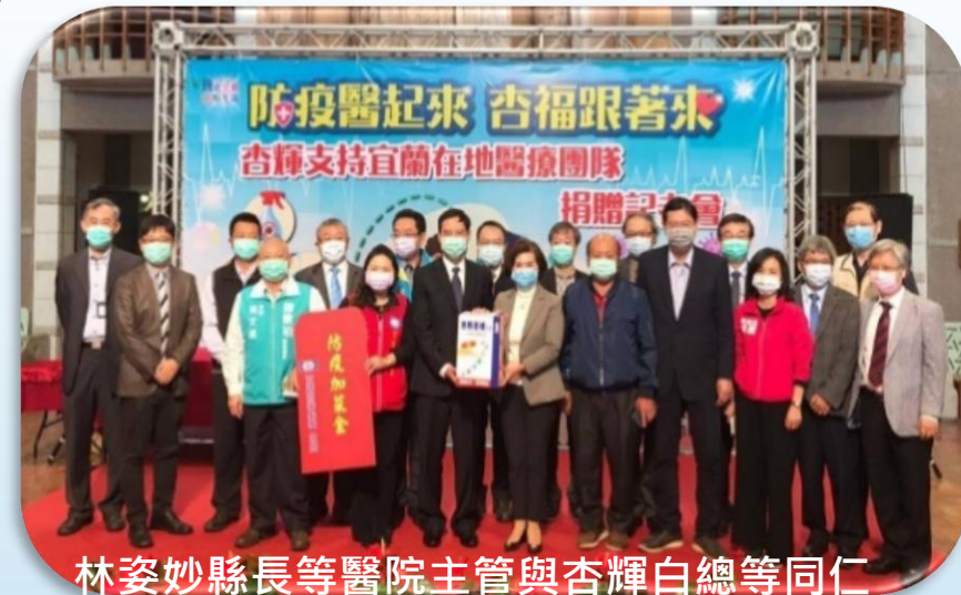
林姿妙縣長等醫院主管與杏輝白總等同仁